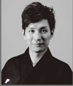
茂山童司 改メ 三世茂山千之丞